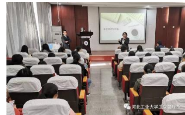
职业规划讲座：事业起点与准备