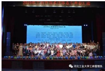
学生自编自导的毕业汇演