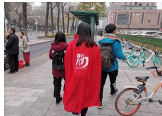
志愿服务活动：善行一百